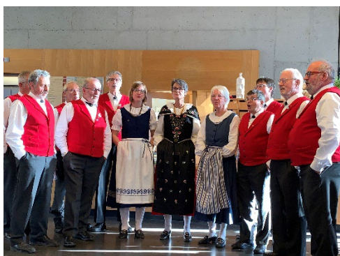
Jodelchörlü Sardona Flims

Insgesamt haben dieses Jahr drei neue Babys von Mitarbeiterinnen die Bewohner kennengelernt. Ein Baby, auf das auch viele Bewohner gewartet haben, kam am 16.11.22 zeitgleich zu einem Bewohnergeburtstag zur Welt. Der Fachbereich Aktivierung hat die Wünsche und Bedürfnisse der Bewohner erkannt und das Programm an den Wochentagen entsprechend gestaltet. Für individuelle Wünsche und Bedürfnisse blieb dieses Jahr mehr Zeit.